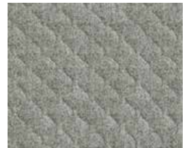
Silverdale QZH28 (White thread)