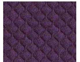
Banbridge QZH32 (Black thread)