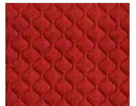
Handcross QZH63 (Black thread)