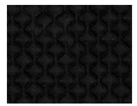
Napier QZH08 (Black thread)