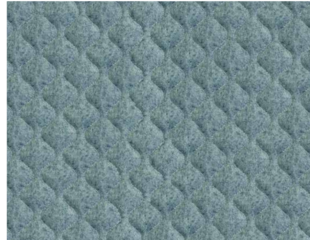
Plymouth (White thread)