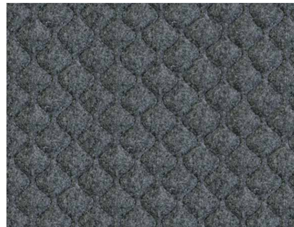
Silcoates (Black thread)