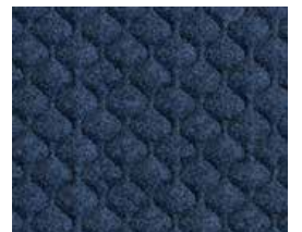
Glenalmond QZH62 (Black thread)